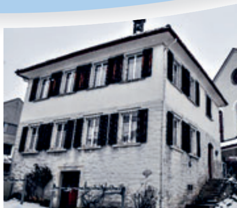
Pfarrheim vor und nach der Renovation