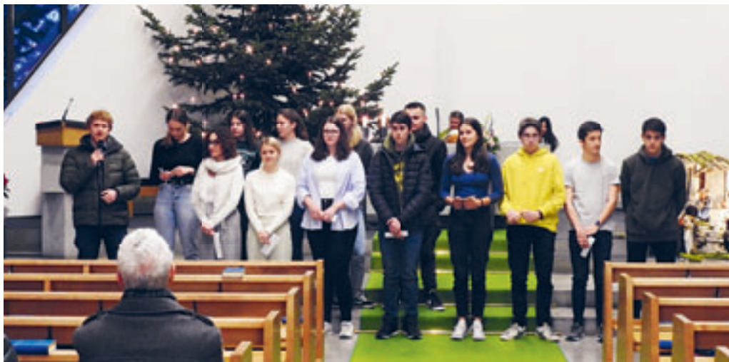
Im Gottesdienst vom 21. Januar fand das öffentliche Ja der Firmanden statt. Damit bekunden die Jugendlichen öffentlich ihren Willen, das Sakrament der Firmung zu empfangen.

Wer keine Veröffentlichung zum Geburtstag wünscht (80. und folgende), wende sich bitte bis am 8. des Vormonats ans Sekretariat.