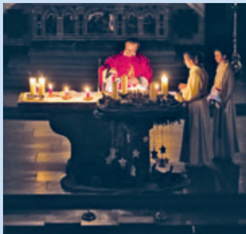
Rorate vom 01.12.22

Fr 06.01. 17.30 Vesper 18.00 Eucharistiefeier mit eucharistischem Segen im Kloster Maria Hilf 20.00 Dreikönigskonzert des Konzertzyklus Altstätten im Kloster Maria Hilf