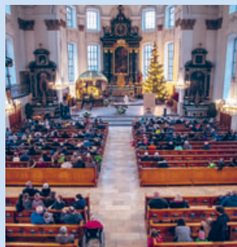
Heiliger Abend im letzten Jahr